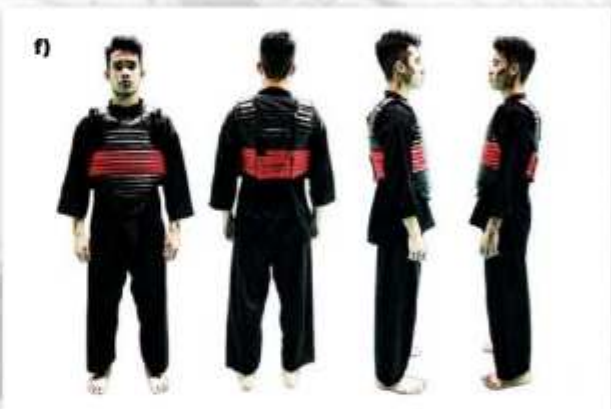
f) ATLET TANDING SUDUT MERAH