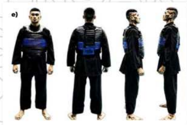
e) ATLET TANDING SUDUT BIRU