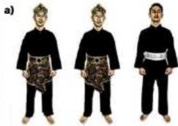
a) ATLET TGR PUTRA