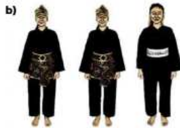
b) ATLET TGR PUTRI