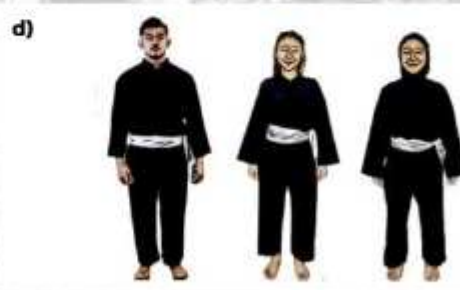
d) ATLET SENI BEREGU