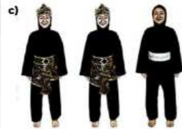
c) ATLET TGR PUTRI BERHIJAB